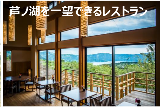
芦ノ湖を一望できるレストラン

箱根最大級クラスの貸別荘 プライベート感=すべて戸建て 1棟ずつ自由に開放的なエリアを確保