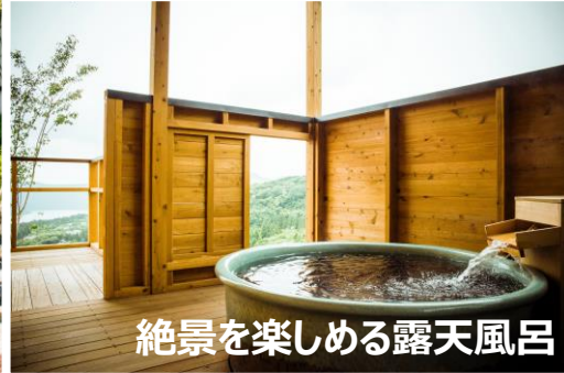
絶景を楽しめる露天風呂